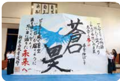
学校祭 書道パフォーマンス