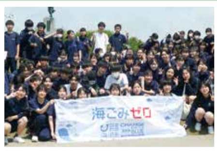
ももさだ海岸ボランティア

新屋高校では生徒の自主活動が活発で、海岸のゴミ拾いや特別支援学校・幼稚園等の訪問を通じて、ボランティア活動や交流活動、地域教材の研究活動などを積極的に行い新屋地域との交流を図っています。