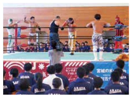
R5 みちのくプロレスによる興行(芸術文化教室)