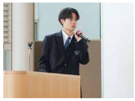
R5 J P X企業体験プログラム株主総会