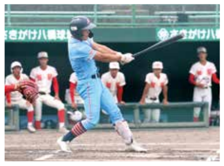
R6 招待試合(智辯学園高校)

今年度、創立40周年をむかえることから、さまざまな新しい取り組みに挑戦して参りました。