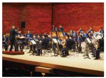
R5 自衛隊音楽会(芸術鑑賞教室)