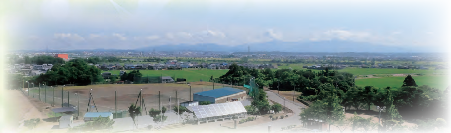
学校より太平山系をのぞむ

現在は、1学年5クラスの普通高校です。体験学習や各種の集団活動がしやすいメリットを生かし、一人ひとりに目を配り、生徒達の豊かな心と個性を伸ばすことを大切にした学習指導と進路指導をしています。