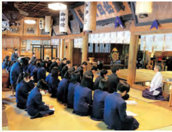
地域コミュニケーション