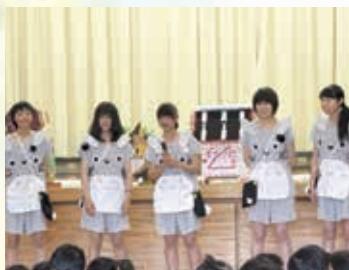
新高祭での幼稚園仮装訪問