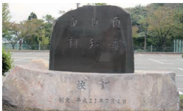
「自尊 自知 自制」 ——自分を大切に、自分をわかまえ、自分の欲望をおさえる。—— 校訓(平成21年7月4日制定)