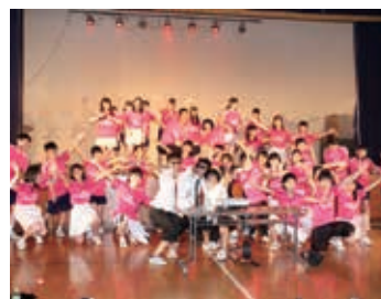
新高祭 クラスパフォーマンス