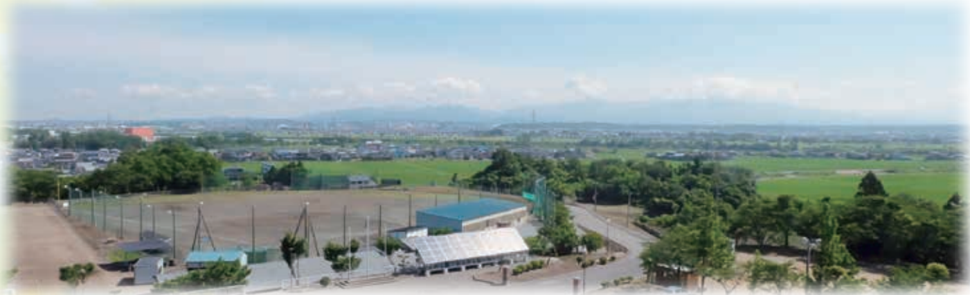
学校より太平山系をのぞむ

現在は、1学年5クラスの普通高校です。体験学習や各種の集団活動がしやすいメリットを生かし、一人ひとりに目を配り、生徒達の豊かな心と個性を伸ばすことを大切にした学習指導と進路指導をしています。