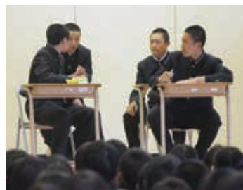
スクールマナー教室